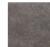
R1XF Orme Fumo 15x15