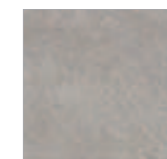
R1XE Orme Grigio 15x15