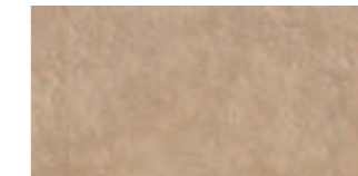
R27S Orme Beige 15x30