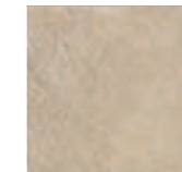
R1XC Orme Bianco 15x15