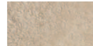
R27R Orme Bianco 15x30